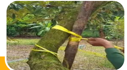
ผูกยึดค้ำยันกิ่ง ป้องกันลมแรง