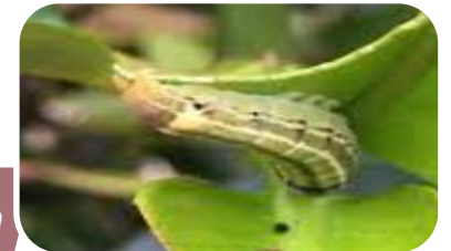
ระวัง ศัตรูพืชจำพวกหนอน