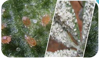
ระวัง ศัตรูพืชจำพวกเพลี้ยและไรต่างๆ