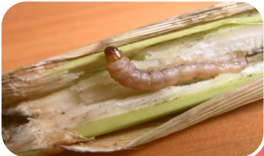
ระวัง ศัตรูพืชจำพวกหนอน