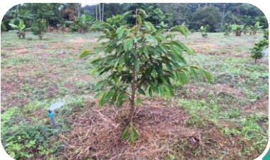
คลุมดิน เพื่อการระเหยของน้ำ