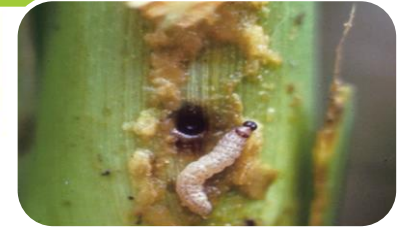
ระวัง ศัตรูพืชจำพวกหนอน